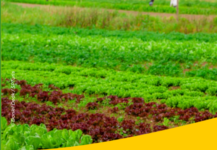
Sítio São Judas Tadeu

El Polo de Ecoturismo alberga varios tipos de unidades de conservación que, además de servir como santuario para la preservación de la fauna y flora nativa de la Mata Atlántica, ofrecen opciones de ocio, senderos y paisajes impresionantes. Conoce los Parques Naturales Municipales, el Parque Estatal, las Reservas Privadas de Patrimonio Natural, el Parque de Aventura y ¡(re)conéctate con la naturaleza!