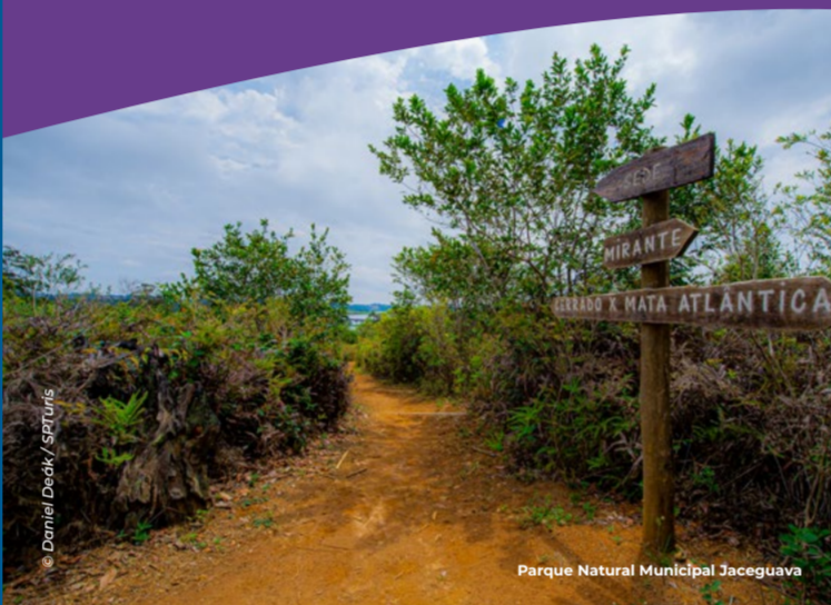
Parque Natural Municipal Jaceguava

Saliendo desde el centro de la ciudad, este será probablemente el primer circuito que visitarás. Cruzando el portal de Parelheiros, encontrará el Centro de Información Turística, donde podrá recibir información sobre la región. En este circuito, que bordea la represa de Guarapiranga, se encuentra el Parque Natural Municipal Jaceguava, una unidad de conservación marcada por la Mata Atlántica, con parches característicos del cerrado. Las propiedades rurales ya están presentes en este circuito.