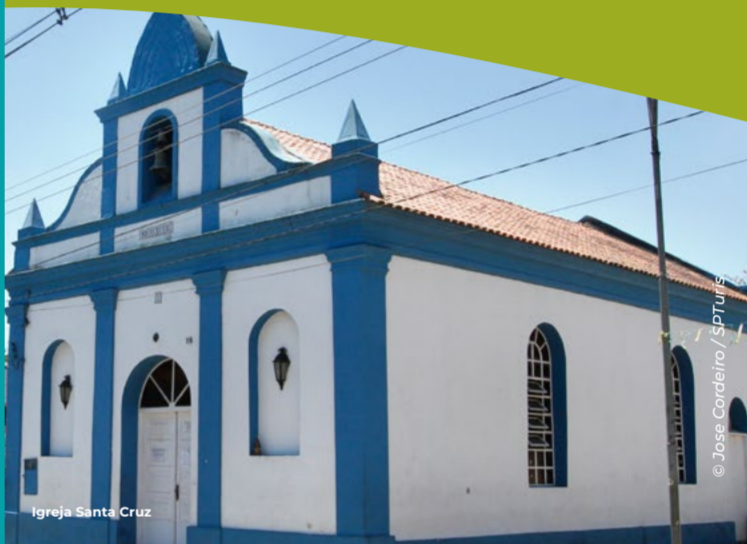
Igreja Santa Cruz

Continuando hasta el final de la Carretera Ecoturística llegamos al Circuito de Parelheiros. Aquí la ciudad inicia su transición de lo urbano a lo rural y las construcciones dan paso a la naturaleza. Con aire de ciudad rural, en el centro de Parelheiros se encuentra la plaza central, donde se encuentran la Iglesia de Santa Cruz y la estatua de María Carolina de Jesús, importante escritora negra de la literatura brasileña, residente en Parelheiros. Los sitios empiezan a tener una presencia más marcada. En este circuito se encuentra el Parque Natural Municipal de Itaim.