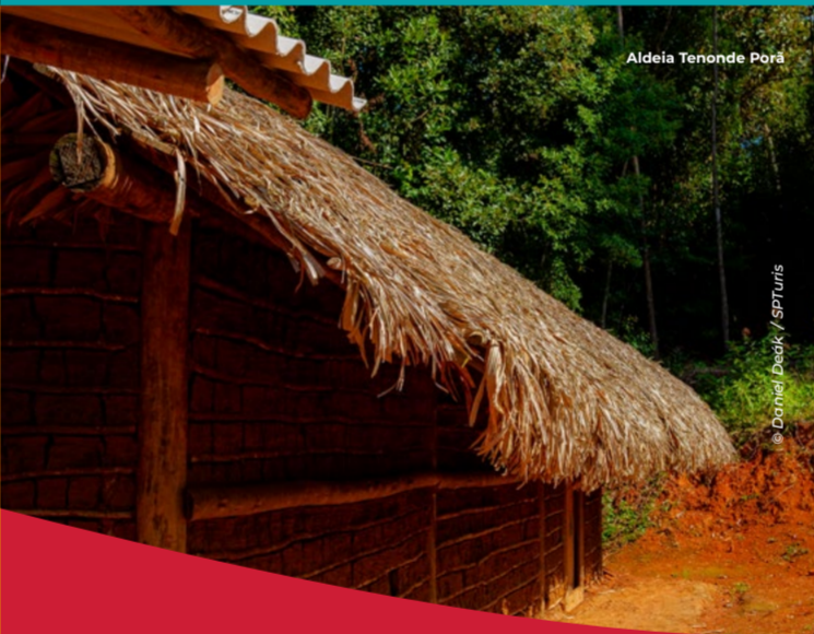
Aldeia Tenondé Porá

Accesible a través del ferry que cruza la Presa Billings, el Circuito de Bororé, en la península conocida como Isla de Bororé, alberga una importante escena cultural en las comunidades periféricas. El cicloturismo también es una característica de este circuito, que alberga el inicio (y el final) del Sendero Interparques, el primer sendero de largo recorrido de la ciudad de São Paulo, de 170 km, casi todos dentro de la ciudad. En el circuito se encuentran los Parques Naturales Municipales de Bororé y Varginha.